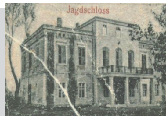
Palac w latach świetności. Fragment pocztówki z początku XX wieku.

W 1991r. obiekt został wpisany przez Wojewódzkiego Konserwatora Zabytków w Częstochowie do rejestru zabytków podlegających ochronie.