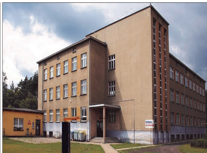
Zespół Szkół i Przedszkola w Miotku