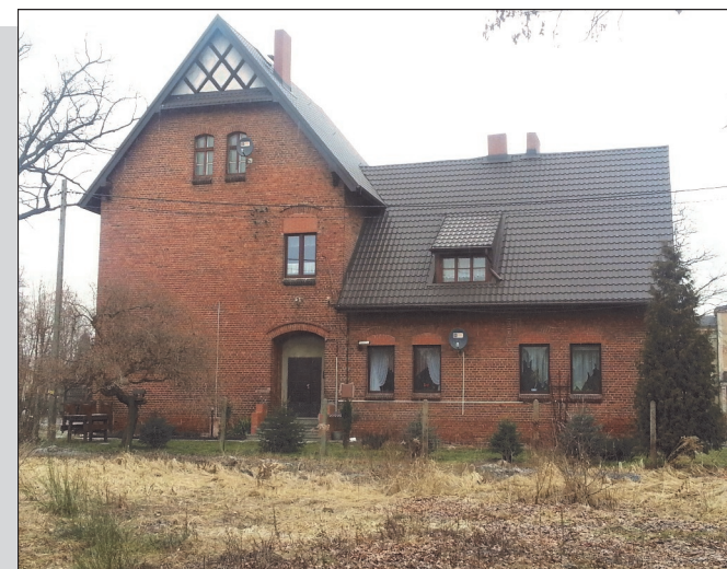
Stara szkoła w Zielonej. Stan obecny