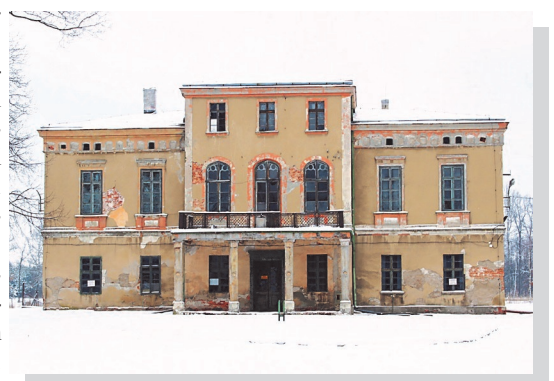
Palac obecnie. (zdjęcia wewnątrz na stronie www.elgra.eu/galeria.php )

W czasie II wojny światowej w Zielonej stacjonował jeden z ukraińskich oddziałów SS. Po 1945 r. na długie lata powrócili tam leśnicy, którzy zarządzali tym terenem leśnym,